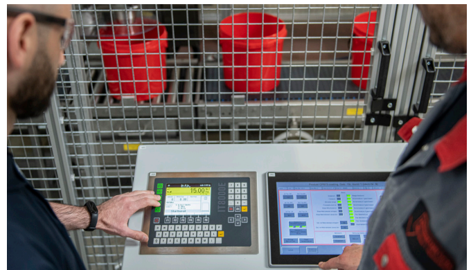
Leistungsstarke Wägeelektronik IT8000E von SysTec

So können 280 Eimer einer 5 Liter-Größe pro Stunde befüllt werden. Bei den großen 20 Liter-Eimer schafft die Anlage 220 Stück pro Stunde.