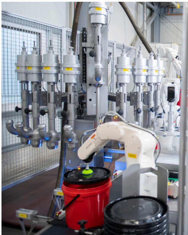
Präzise Prozesse mit hochwertigen Abfüllstutzen