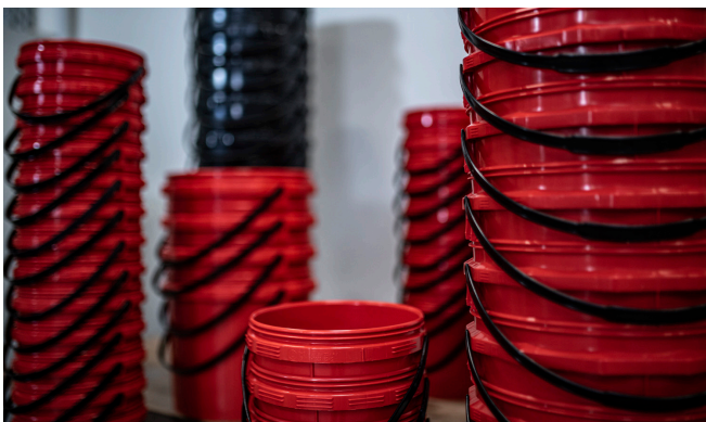
Schnelle Abfüllung unterschiedlicher Eimer-Größen