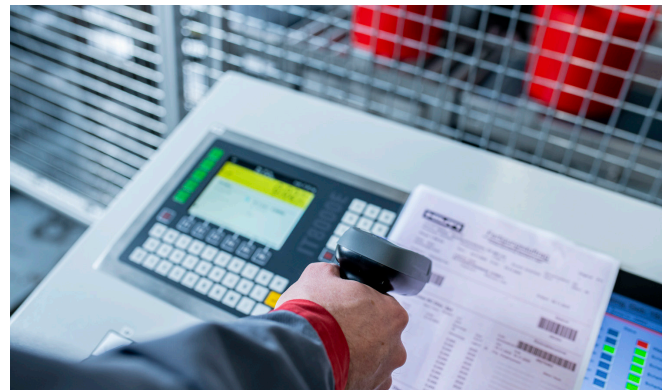
Einscannen des Produkt-Codes vor dem Abfüllprozess

Die hochflexible Beschichtung trocknet schnell zu einer elastischen Schutzschicht und ist rauchdicht.