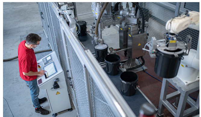
Der Anlagenbauer Kestermann testet den Abfüllprozess